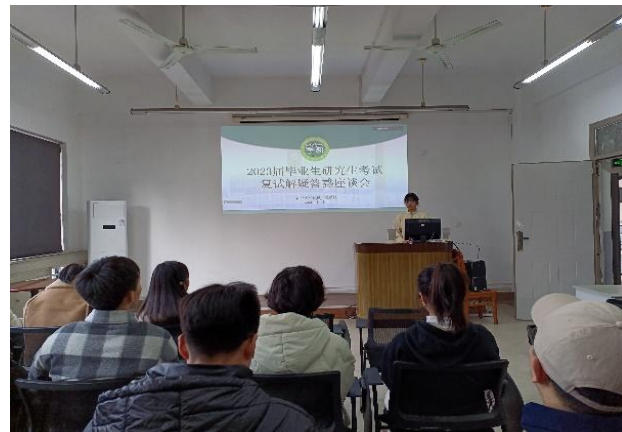
图 32 召开 2023 届研究生开展复试经验分享会