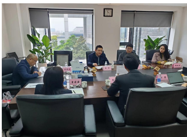
图 50 开展“访企拓岗”和党建调研系列活动