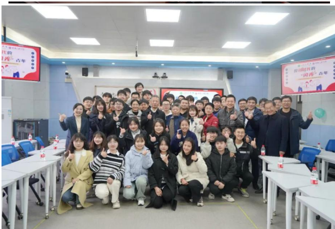
图 25 召开由校领导参与的“做新时代的闪光青年”主题班会