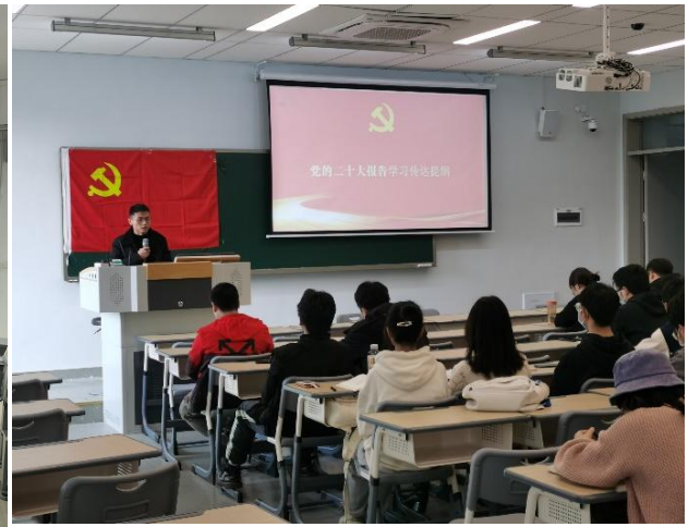
图6 宜宾校区工设与机制专业召开学习二十大主 题活动