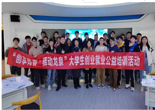
图 46 组织师生参加“创享青春·驿动龙泉”大学生创业就业公益培训活动