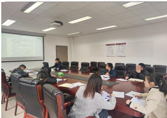
图 45 召开职业生涯规划大赛学院选拔赛