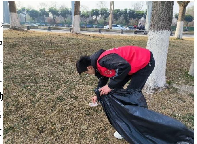
志愿者们义务清理垃圾