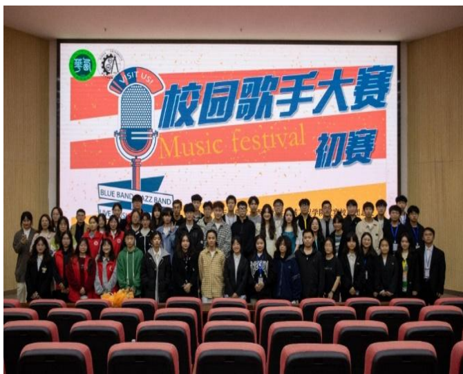
图 23 宜宾校区成功举办“时代勇赴新征程，青年振奋续华章”歌手大赛

3月30日中午12:30，在团总支负责人周老师的指导下，宜宾校区团总支开展了五四先进团支部答辩活动，五位团支部代表人进行答辩，学院周岐燃、薛敏老师，体育学院李云鹏老师以及近150名参与此次会议。各团支部答辩人依次登台，从组织建设，学风建设，思想政治建设等方面展示了团支部一年以来取得的阶段性成果以及对未来工作的规划，团委老师对答辩人进行提问以及给出宝贵的建议。最后，团总支书记周岐燃老师就本次答辩进行总结，指出五四答辩会更像是一个交流会，要求各团支部之间应相互学习，取长补短。并要求每一个存在挂科的班级都建立学习小组，进行一对一帮扶，希望团干部一定要做好带头作用，从“有字之书”和“无字之书”两方面加强学风建设。（供稿人——陈莉萍）