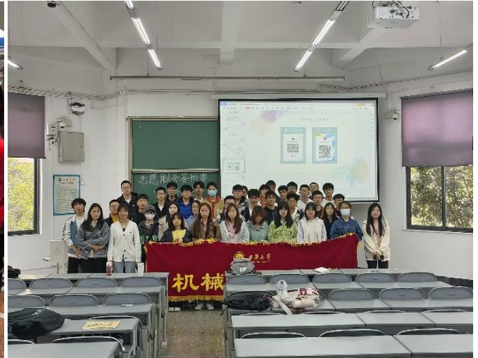
图 20 召开志愿服务答辩赛宣讲会