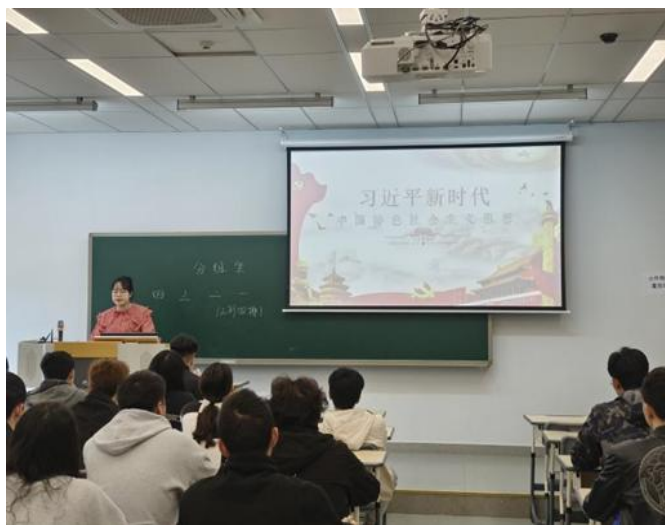
图2 召开《习近平新时代中国特色社会主义思想学习问答》书籍学习交流会