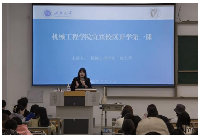
图 35 宜宾校区召开“开学第一课”等系列活动