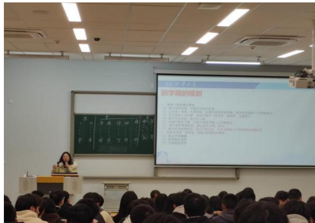
图 26 召开“筑梦新起点，一起向未来”主题班会