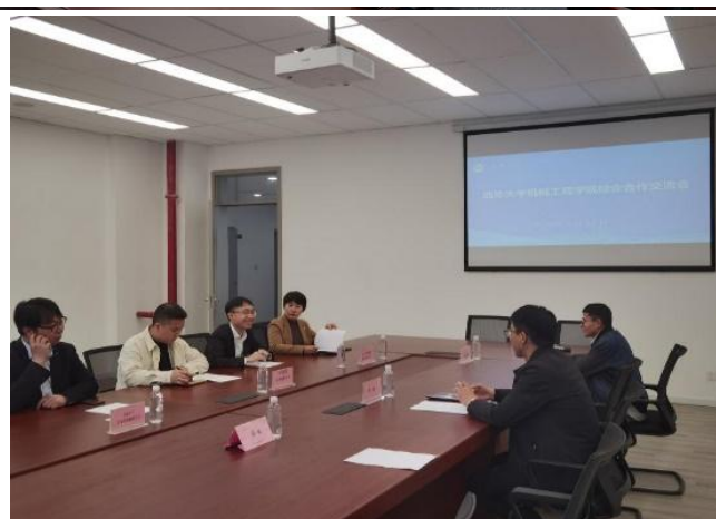
图 49 宜宾校区组织召开校企合作交流会