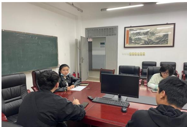
图 43 新向往，“心”行动--心理工作研讨会 1