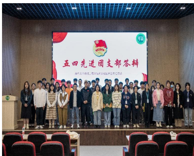
图 24 宜宾校区开展五四先进团支部答辩工作