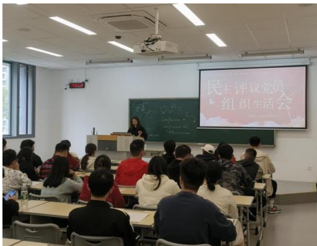
图 11 宜宾校区工设与机电专业学生党支部谈心谈话活动