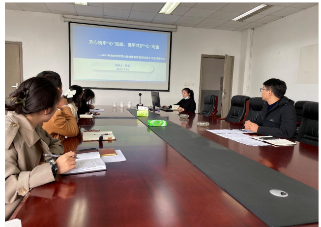
图 42 齐心筑牢“心”防线，携手共护“心”周全——机 械工程学院心理工作布置会