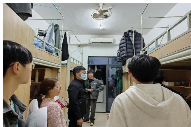
图 40 宜宾校区组织召开 20、22 级学生寝室安全、卫生大检查 2