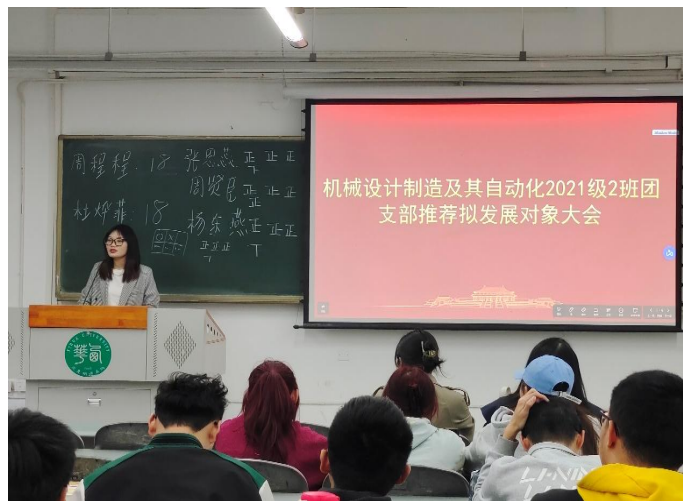
图 12 组织推优入党和推荐拟发展对象大会