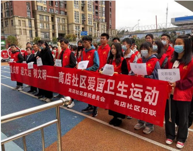
图 19 举办“爱成都，迎大运，树文明”高店社区爱国卫生运动