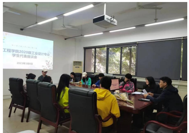
图 34 召开 2020 级工业设计专业学生代表座谈会