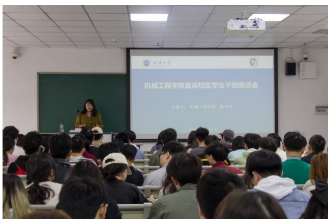
图 27 召开学生干部座谈会