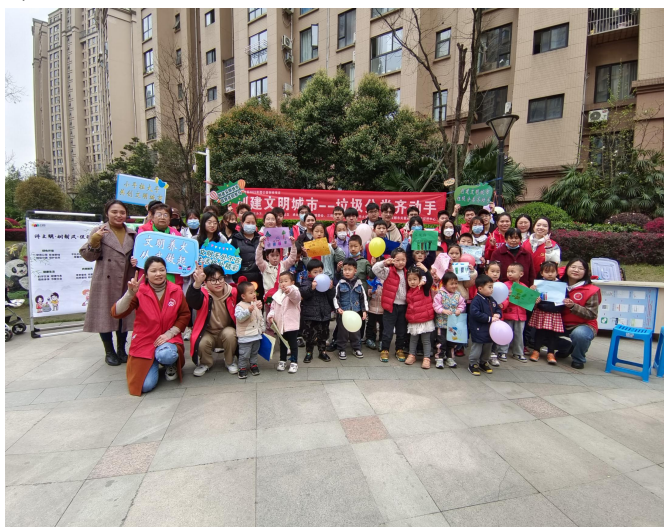
图 9 “创建文明城市——垃圾分类齐动手”活动顺利开展