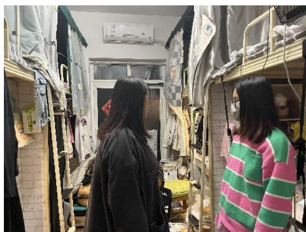
图 38 走访毕业生寝室