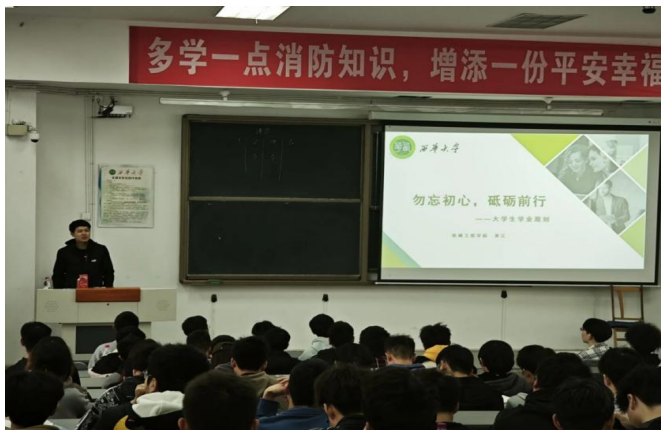
图 31 召开勿忘初心, 砥砺前行——2021 级机械电子工程专业班导师见面会