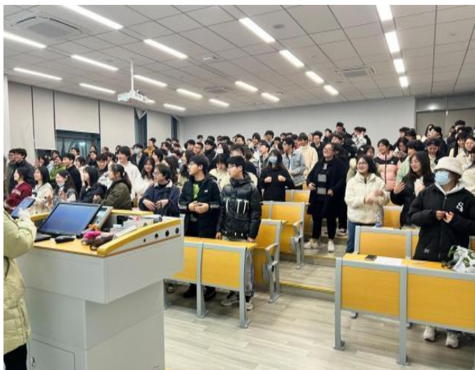
图1 召开“青春践行二十大，学风营造党员行”支部组织生活会