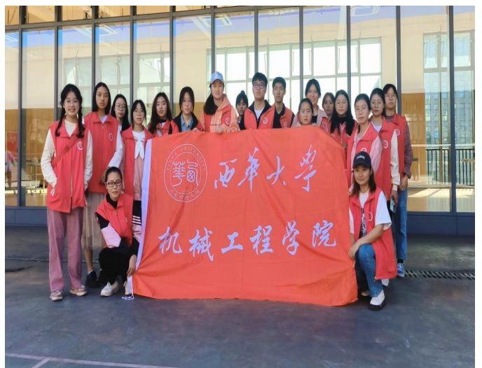
图 22 宜宾校区成功举办“聚首‘羽’林，精彩飞扬”羽毛球大赛