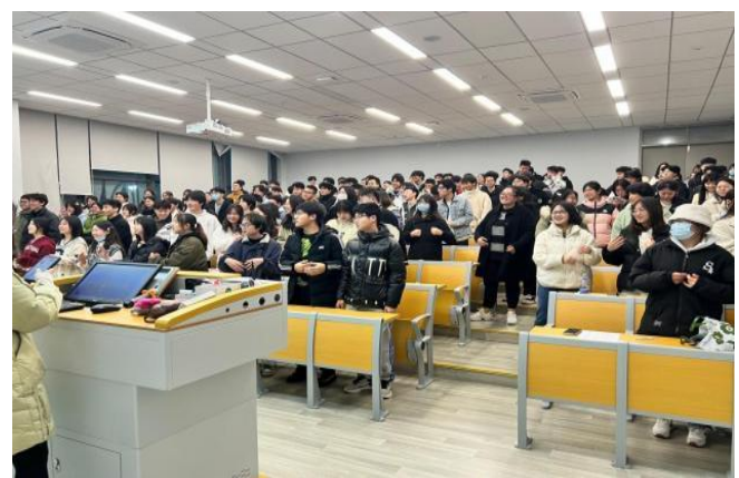
图 36 召开“青春践行二十，营造良好学风” 主题班会