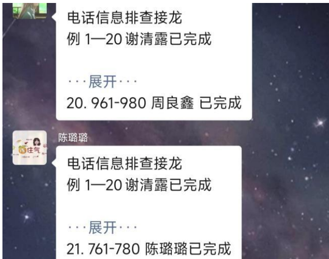
图 15 排查疫苗接种，构建全面免疫