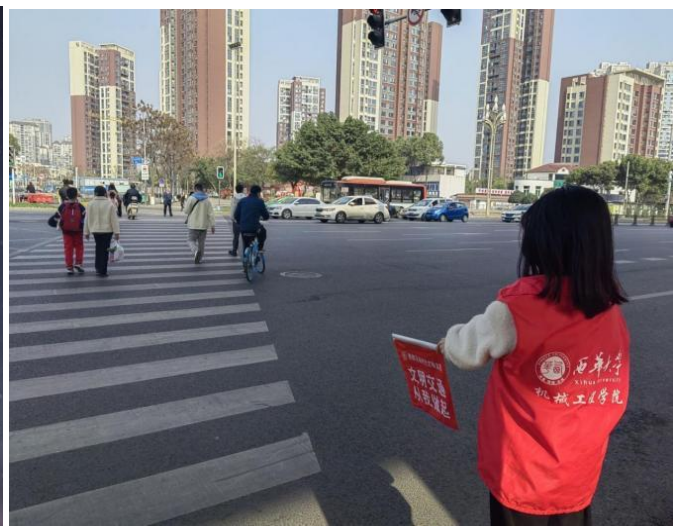
图 16 文明劝导志愿者指挥交通