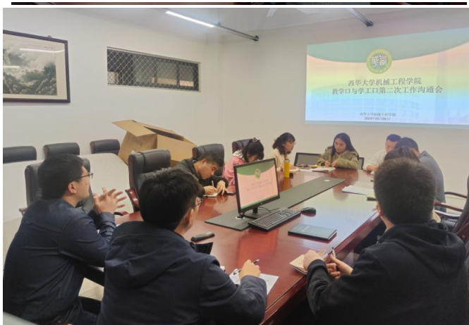
图 33 学工口与教学口加强沟通互动