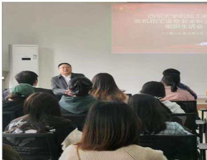
图3 召开“发扬自我革命精神、不断提高党性修养”主题党日活动