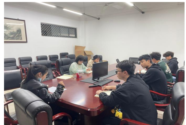
图 44 新向往，“心”行动--心理工作研讨会 2