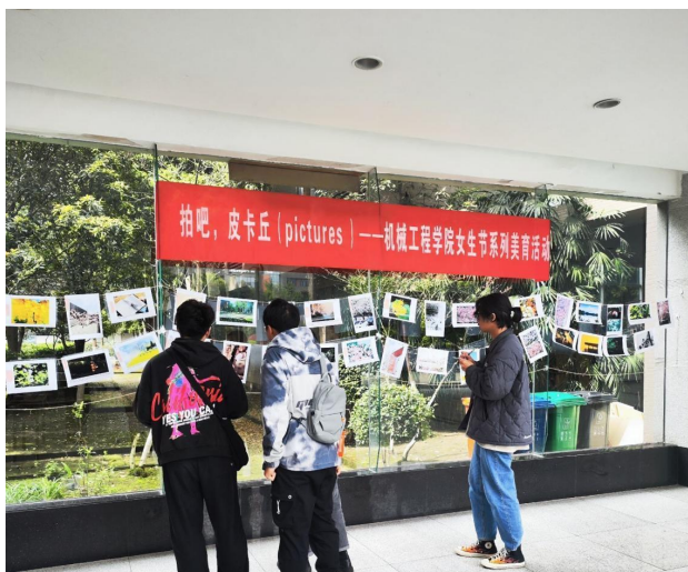
图 13 春天的影像画册——第十八届女生节美育活动 1