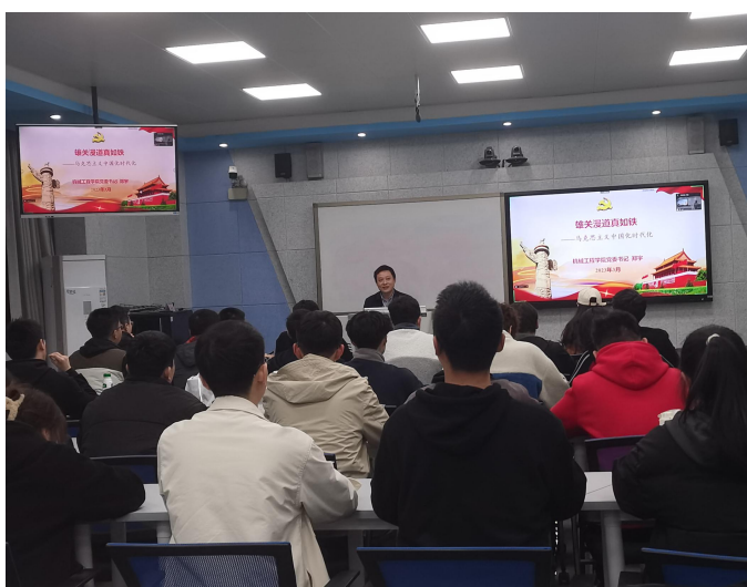
图 7 举行 2023 年春季学期入党积极分子、发展对象培训班开班仪式暨党课第一讲