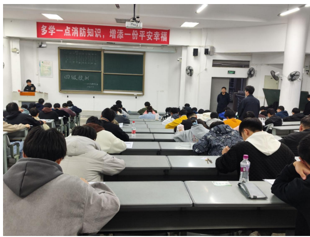
图 30 组织四级模拟考