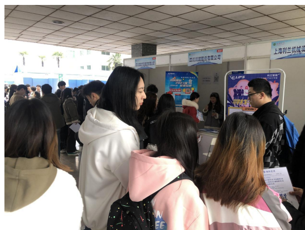
图 48 邀请校友及校友企业返校举行专场毕业生招聘会