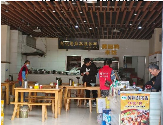
两个小时的时间就使沿街面貌发生较大改观，以实际行动践行新时代雷锋精神，彰显机械工程学院志愿者们的不怕苦，不怕累的吃苦精神。