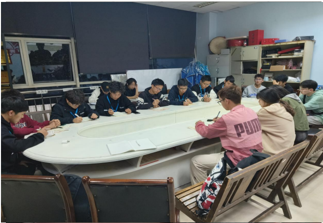
图 41 暖心引航,健康成长——机械工程学院心理委员 工作交流会