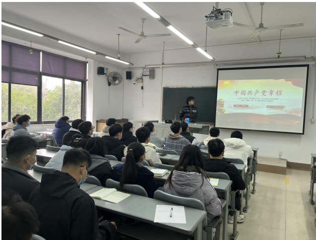
图5 召开学习“党的二十大报告和党章”主题党日 活动