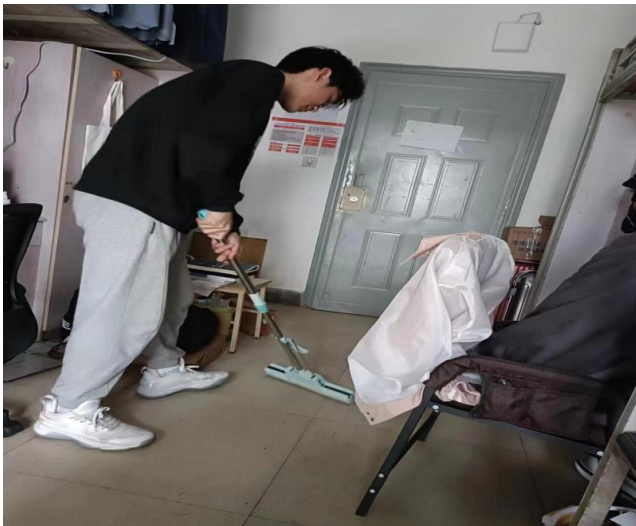
图 21 召开“青春践行二十大，美丽校园共缔造”劳动教育主题实践活动