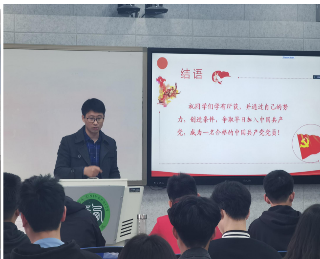
图 8 学院 2023 年春季学期入党积极分子培训班党课