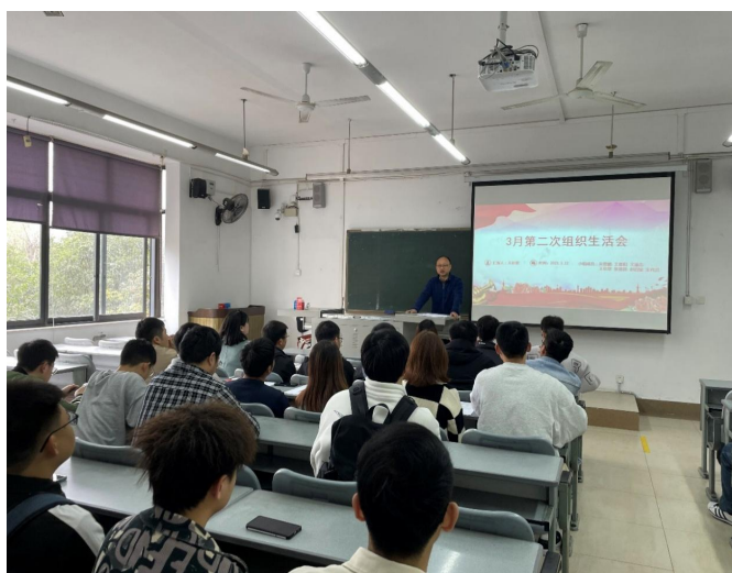
图4 召开学习“中共二十届二中全会精神”组织生活会