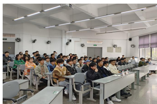
图 28 召开班长团支书大会