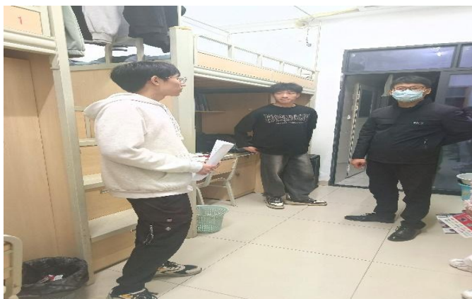
图 39 宜宾校区组织召开 20、22 级学生寝室安全、卫生大检查 1